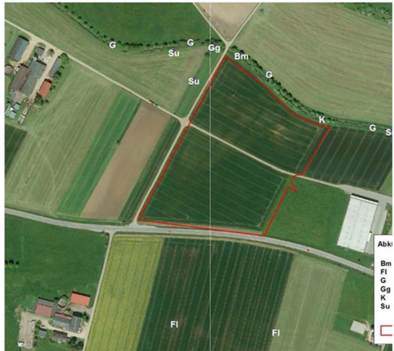
Abbildung 1: Grenze des Geltungsbereichs und Revierverteilung der nachgewiesenen

Dipl.-Biologe Mathias Kramer hat im Jahr 2020 eine ergänzende artenschutzrechtliche Prüfung, insbesondere im Hinblick auf Vorkommen der Art Feldlerche, vorgenommen. Dabei kommt er zu folgendem Fazit: